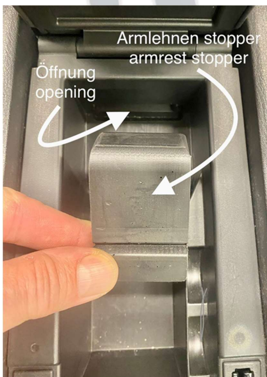
Afbeelding 3 „Opening“ „Armsteun stopper“