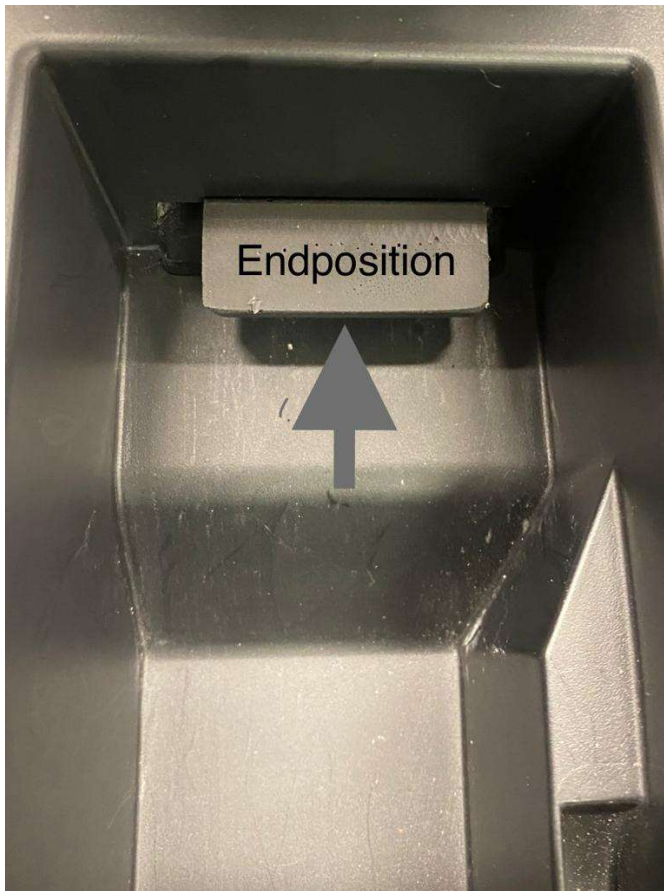
Afbeelding 5 „Eindpositie“