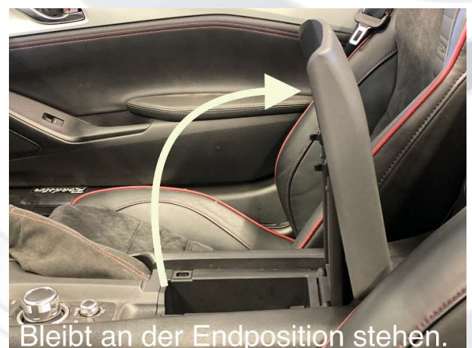
Afbeelding 8 „Blijft in de eindpositie staan“